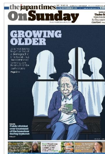
〈The Japan Times On Sunday〉